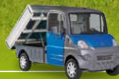
Version benne basculante