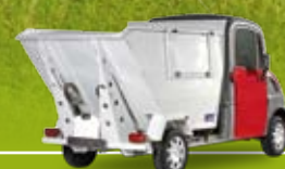
Version benne à déchets

➤ CHARGE ET VOLUME UTILES : Jusqu'à 680 kg - Jusqu'à 3 m 3