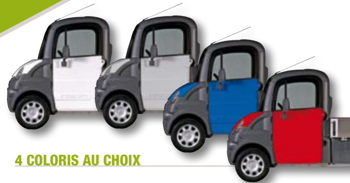
4 COLORIS AU CHOIX