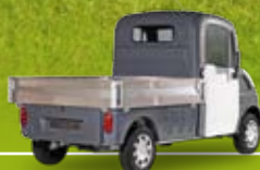
Version plateau ridelles